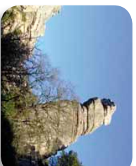
comenzamos la ligera ascensión que nos llevará de nuevo hasta el Centro de Visitantes por los hoyos de la burra y de la rucha.