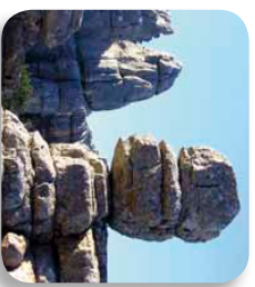
A lo largo del recorrido veremos cómo la erosión del viento, del hielo y del agua ha esculpido formas caprichosas en la roca caliza

rutas comienzan observadas por la formación rocosa conocida popularmente como El Vigilante (ver [2] en el mapa), de manera que una vez pasada la localización del gran Arce de Montpellier [3] aparece un desvío, en el que debemos continuar por la derecha. Conforme vamos avanzando podremos ver otras formaciones rocosas características como son La Jarra [4], La Grieta [5] o El Burladero [6]; poco después de este, podemos desviarnos para ver las figuras del Pílon [7] y el Pílo [8], y continuaremos el camino para encontrar El Camello [9] y El Adelantado [10].