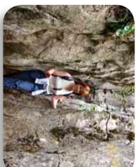
Este pasillo rocoso es un ejemplo de diaclasa o fractura que origina un típico callejón, su anchura solo permite pasar a las personas de una en una