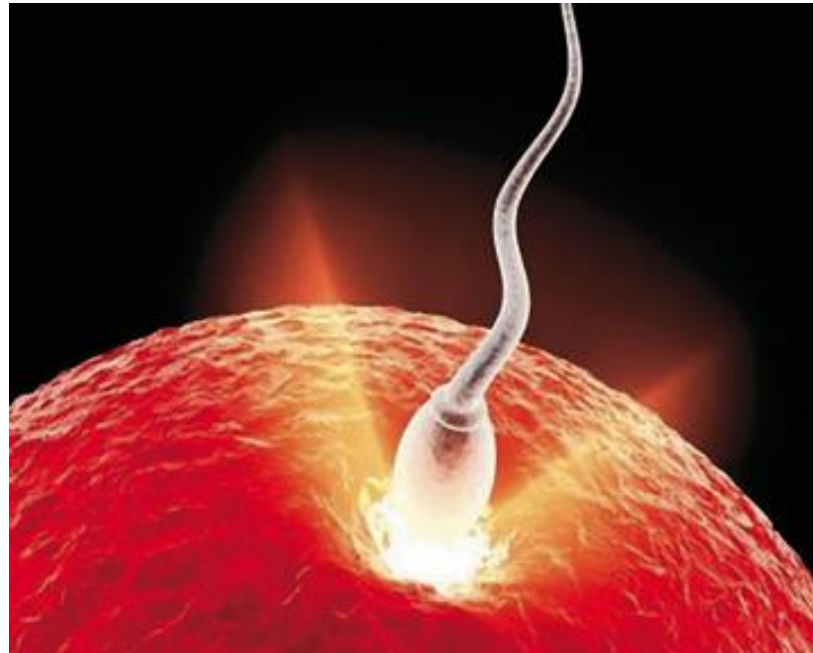
Instante de la concepción

(Genetista de fama mundial, descubridor del síndrome de Down).